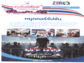
9 ต.ค. 2568 ต่อต้านคอร์รัปชันสากล (ประเทศไทย) ภายใต้ แนวคิด HERO OF THE TRUTH