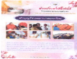
17 ต.ค. 2568 โรงพยาบาลอมก๋อย ได้จัดพิธีทำบุญโรงพยาบาล ประจำปีงบประมาณ 2569