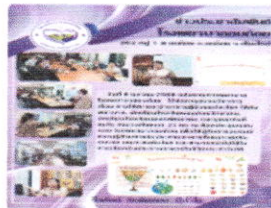
8 ต.ค. 2568 กลุ่มงานการพยาบาลโรงพยาบาลอมก๋อย ได้ จัดการอบรมวิชาการเรื่อง การให้คำแนะนํา อาหารผู้ป่วยแต่ละโรค