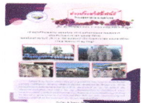
29 ก.ย. 2568 เจ้าหน้าทีโรงพยาบาล เข้าร่วมกิจกรรม เคารพธงชาติเนื่องในวันพระราชทานธงชาติ ไทย เนื่องด้วยวันที่ 28 ก.ย. 68 ของทุกปี เป็น วันพระราชทานธงชาติไทย (Thai Nation Flag Day)